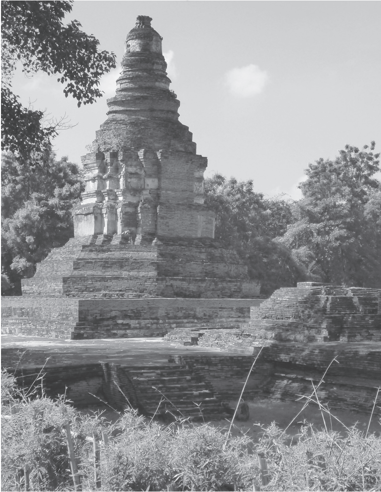
▲ วัดอীগัง เวียงกุมกาม จังหวัดเชียงใหม่