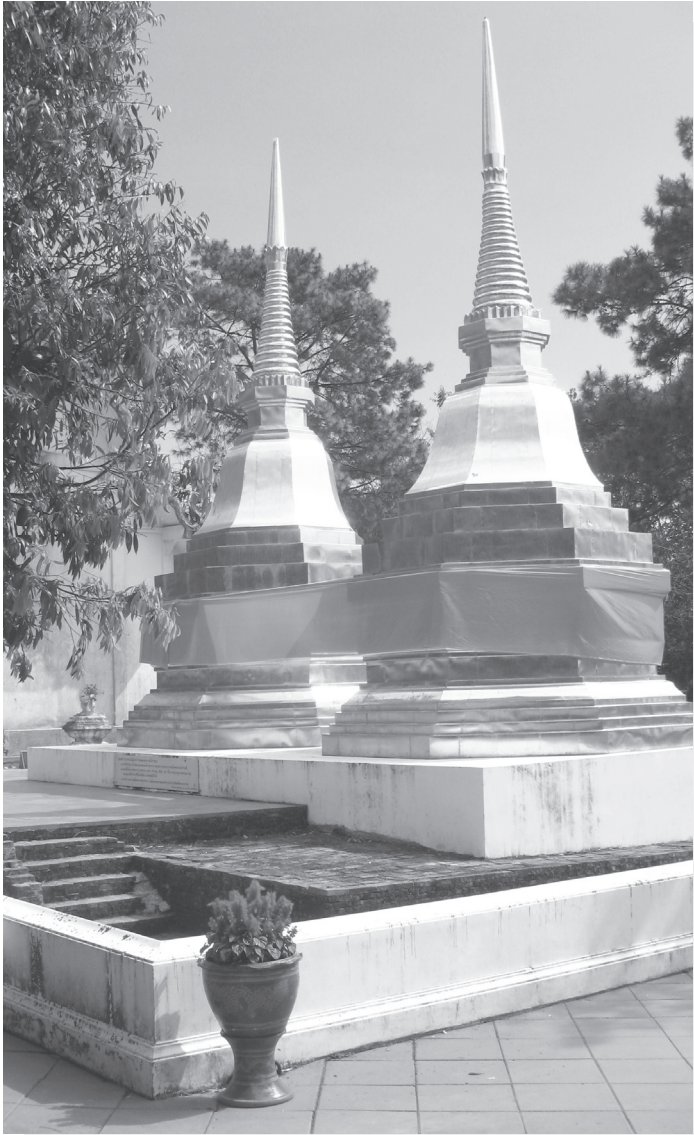
▲ พระธาตุดอยตุง จังหวัดเชียงราย